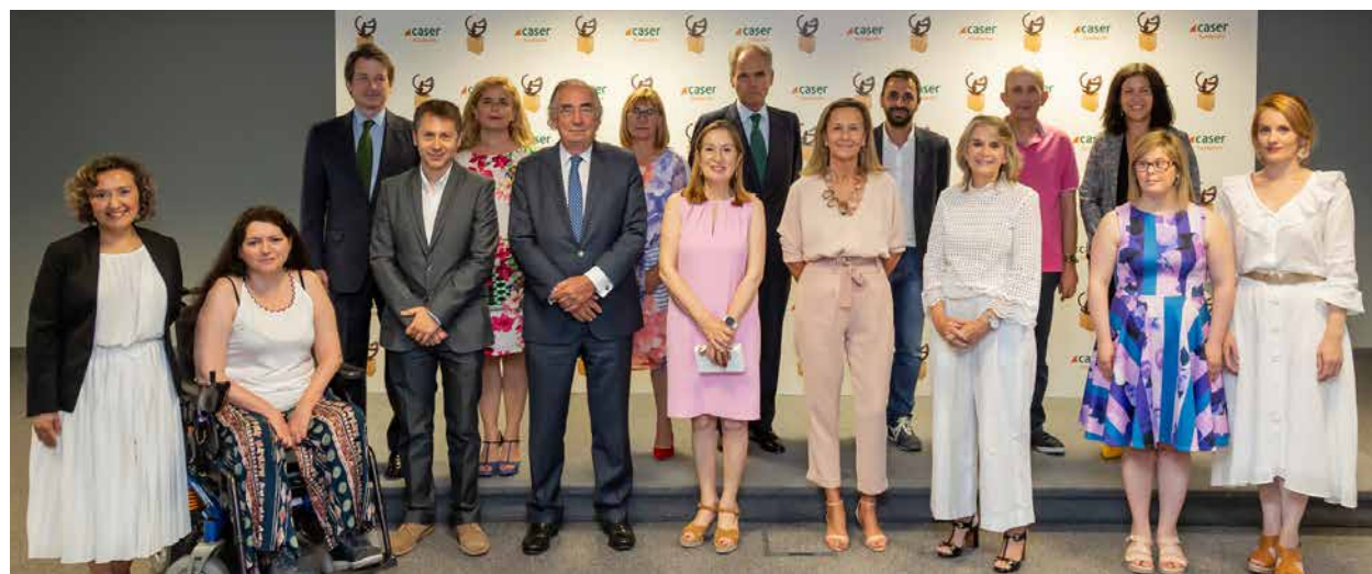
Foto de familia de los ganadores de la décima edición de los Premios Dependencia y Sociedad.

Por otro lado, en la categoría de comunicación, el programa de televisión “Héroes Anónimos” de Castilla-La Mancha Media TV fue el premiado por su enfoque en el que aborda diferentes realidades sociales con el fin